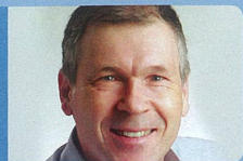
JA JEAN AUBRY

D'une couleur rouge rubis assez soutenu, il émane de ce barbera des arômes complexes de fruits noirs notamment la cerise, auxquels se mêlent des effluves floraux sur la pivoine et des notes légèrement épicées. Bien structuré, il se révèle friand en bouche grâce à une fraîche acidité et des tanins soyeux. Il revient en finale sur les effluves sentis au nez pour