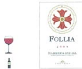
FOLIA 2009, BARBERA D'ALBA, PODERE CASTORANI 14,75 $ 10966811

D'une couleur rouge rubis assez soutenu, il émane de ce barbera des arômes complexes de fruits noirs notamment la cerise, auxquels se mêlent des effluves floraux sur la pivoine et des notes légèrement épicées. Bien structuré, il se révèle friand en bouche grâce à une fraîche acidité et des tanins soyeux. Il revient en finale sur les effluves sentis au nez pour